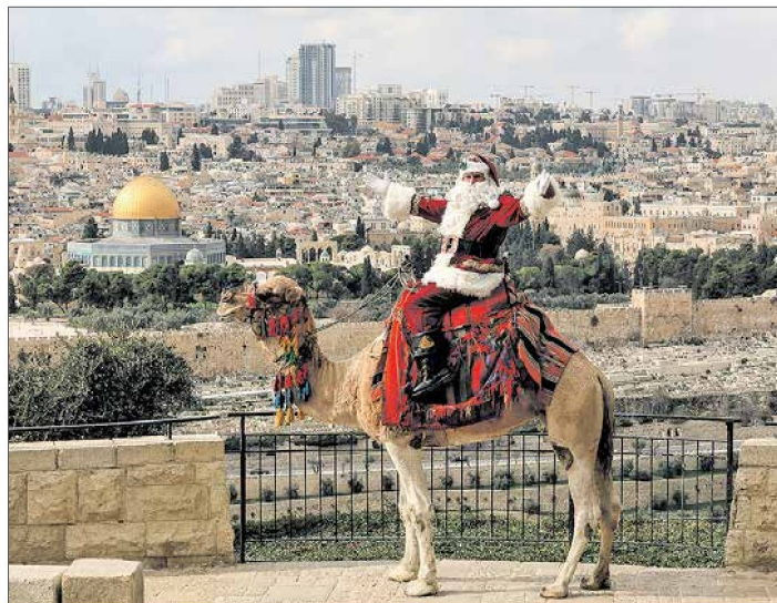
Palesztin Mikulás az Olajfák hegyén. Nemzetépítés vagy -pusztítás?

– A Netanjahu-ügyben jól látszik, mennyire. Az államhatalmi szervek: az ügyészség, a rendőrség, valamint a sajtó intim és korrupt viszonyban állnak egymással. Vannak, akik azt mondják erre, a sajtó szolgálja ki az állami szerveket, szerintem viszont fordított a helyzet: utóbbiak lettek a média nyomozórezsége. Ugyanis a Netanjahuval szembeni korrupciós vádak – például a „bizalomsértésnek” nevezett gumiszabály – büntetőjogi szempontból nevétségesek, ugyanúgy, ahogy a Donald Trumpgal szembeniek is azok voltak. Nem is rendes büntetőper a céljuk. Hanem az, hogy annyit „piszkot” összehordjanak a médiában Netanjahuról, illetve Trump-ról, hogy az ártson nekik a politikában, a közvélemény-kutatásokban. Ezeket nevezik információs műveleteknek, amelyeket csak erősíteni a folyamatos kiszivárogtatások a sajtónak. De a sajtó nem tár fel semmit, csak kinyomtatja, ami a jobboldalelles szervek érdekében áll. Ostoba módon ráfogják, hogy Netanjahu ügyvédei szivárogtatnak, de ez elég nevétséges érv. Mindehhez hozzájárul, hogy a bíróságok jelentősen bővítették a saját alkotmányos hatáskörüket. A bírók teljhatalmú urak, nincs felettük senki, és elég rendszeren a baloldal felé húznak. Ezért nincsen rendes politikánk Izraelben a törvénytelen bevándorlással szemben, hiszen minden próbálkozást elmeszelnek a bíróságok.