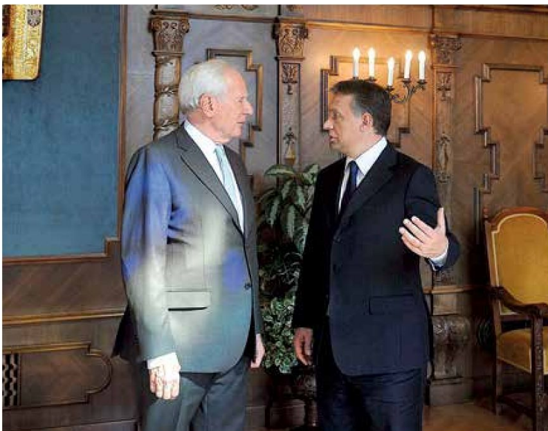
Klaus von Dohnanyi és Orbán Viktor az Országházban 2012. október 4-én