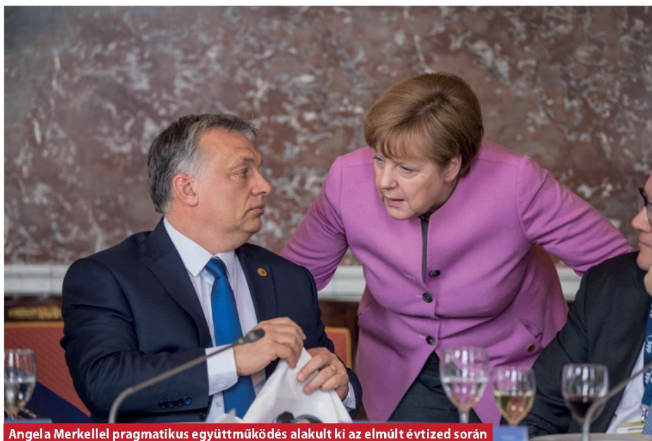
Angela Merckel pragmatikus együttműködés alakult ki az elmúlt évtized során

Angela Merkelhez hasonlóan nyugodt, józan, kiegyensúlyozott politikus, de pontosan ezért nagy valószínűséggel folytatódik a minden irányba nyitott, higgadt politika – fejtette ki a Demokratának az igazgató.