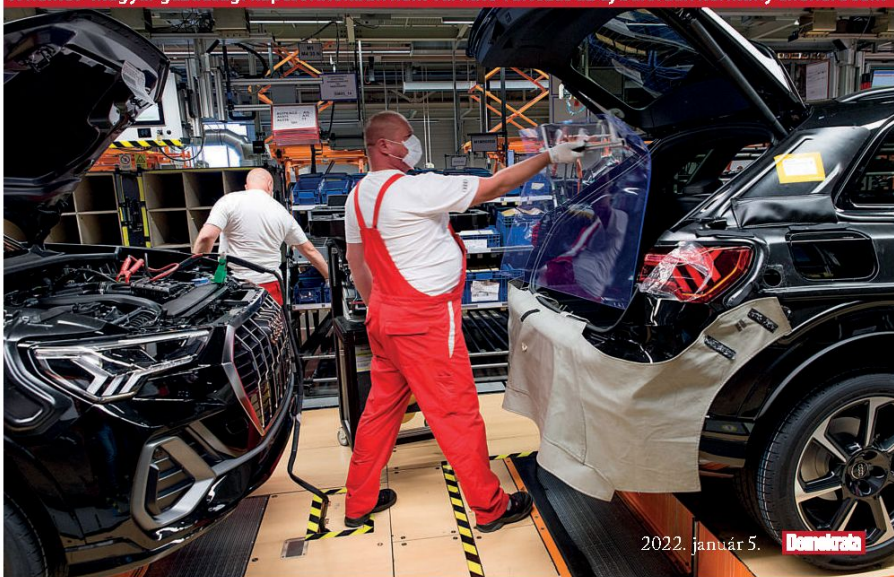
A német-magyar gazdasági kapcsolatokban nem várható változás az új baloldali kormány ellenére sem

– Vannak olyan szimbolikus kérdések, amelyekben az új német kormány markánsabb álláspontot fog elfoglalni, mint elődje. A koalíciós tárgyalások során a Zöldek el tudták érni, hogy Németország a