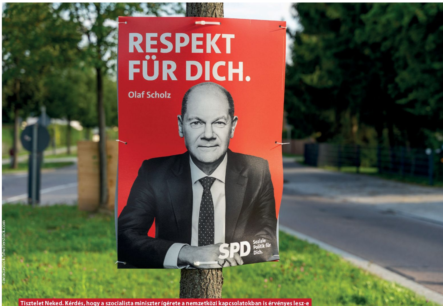
Tisztelet Neked. Kérdés, hogy a szocialista miniszter ígérete a nemzetközi kapcsolatokban is érvényes lesz-e